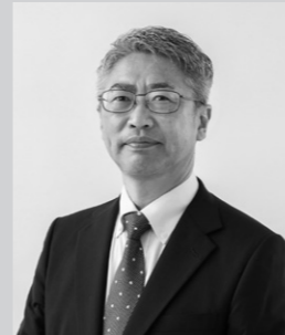
一般社団法人 全国スーパーマーケット協会 常任理事 品質改善委員会 委員長